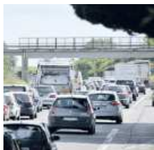
Le lunghe code di ieri sulla 148

una settimana dagli automobilisti costretti a percorrere la Pontina per motivi di studio o lavoro. Lo scorso venerdì lo scontro tra due mezzi pesanti e un'auto al km 18 tra Pomezia e Roma aveva interrotto la cir-